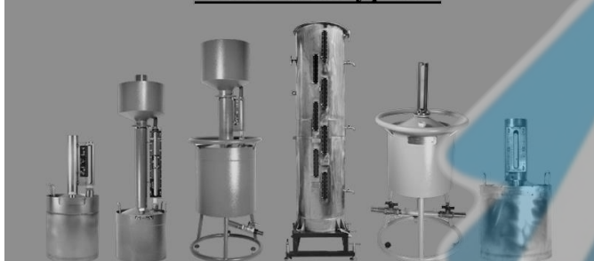
Мерники 1-го разряда